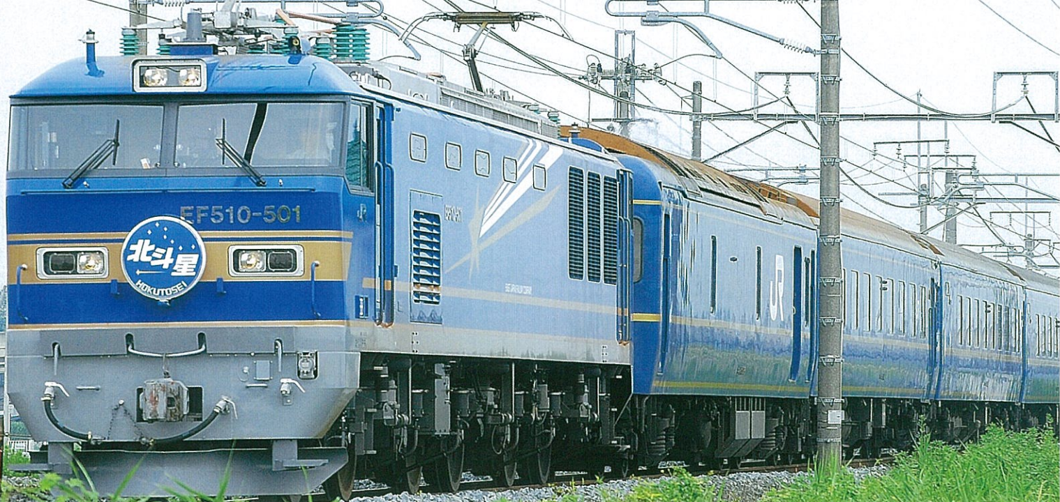
Photos ★ by Rsa - Licensed under GNU Free Documentation License 1.2