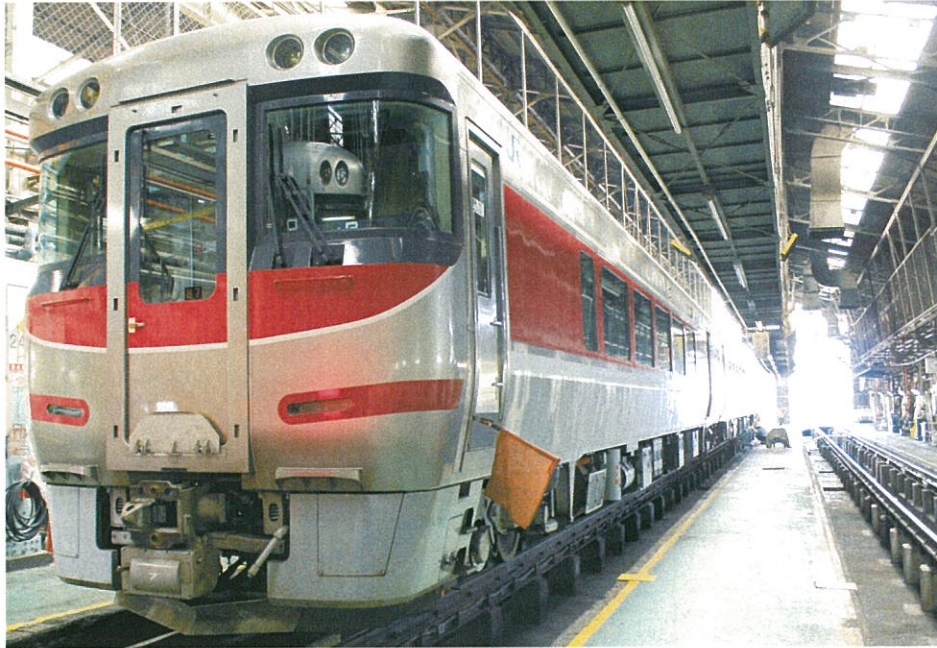
写真は実車です。特別な許可を得て撮影しました

キハ 181 系で運行されておりました特急「はまかぜ」の置き換え用として誕生しました。前面は鋼製、車体はステンレス製の衝撃吸収構造で安全面に配慮されています。各車にエンジン 2 基を備え最高時速 130 km/h 走行が可能です。車内は温かみのある暖色系の照明やキハ 181 系と比べ座席間隔が拡大し居住性にすぐれ、キハ 189 系 0 番代には車椅子対応設備や多目的室を備えております。塗色は運転室窓下及び尾灯部分に茜色、側面は帯状に茜色と白色を配しております。